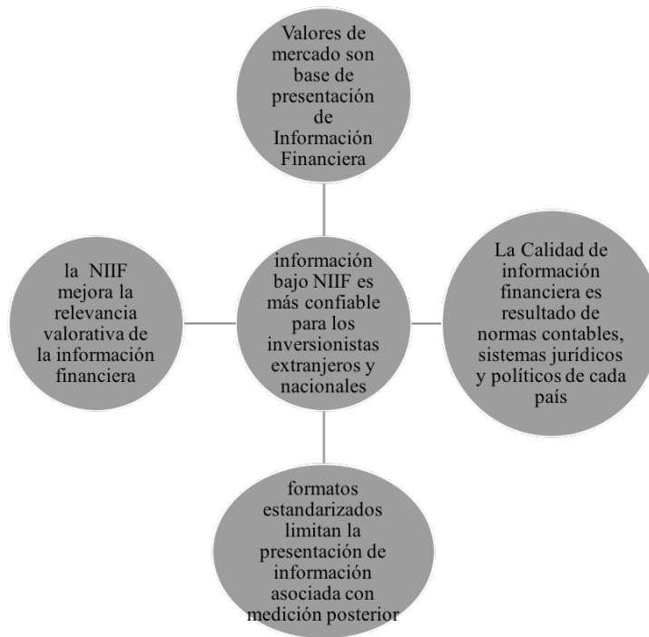
Gráfico 1. Elementos de interés según marco de antecedentes