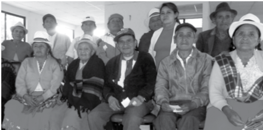
Fotografía: Taller sobre derechos de los adultos mayores