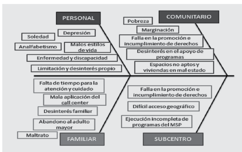
Gráfico N° 1. Causas del deterioro de la salud integral de los adultos mayores de Maluay - el Valle. Cuenca 2013

Fuente: directa Elaborado por: la autora