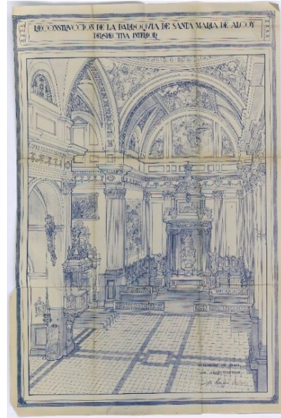
Figura 1: Dibujo de Valls Gadea a partir de una fotografía antigua [España] Ministerio de Educación, Cultura y Deporte

La similitud se hizo más evidente cuando, en 1957, el pintor Ramón Castañer decora parte de sus bóvedas (Botella, 2007) recordando los frescos de Luca Cambiaso en la Basílica escorialense. Por último, la fachada principal presenta un remate en forma de frontón inspirado en la portada del Monasterio; compárese la decoración del tímpano, la bola en el ángulo superior y la forma de las terminaciones laterales inferiores.