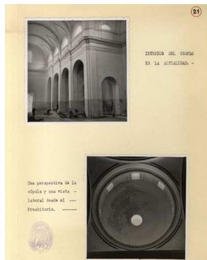
Figura 2: Ministerio de Educación, Cultura y Deporte, España