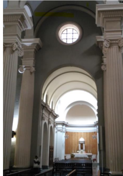
Figura 8: Capilla del Santísimo Iglesia de El Salvador. Elche

En cuanto a los autores de las obras, los artífices de las restauraciones de la posguerra fueron generalmente arquitectos de prestigio, puestos al servicio del régimen porque la dificultad que entrañaba el diseño y ejecución de los edificios religiosos requería un alto nivel profesional para llevarlos a cabo. Aunque utilizaban frecuentemente materiales modernos como el ladrillo y el hormigón para las estructuras, debían mantener las formas historicistas en construcciones de grandes dimensiones. Y así nos lo confirman las autorías de los edificios en cuestión.