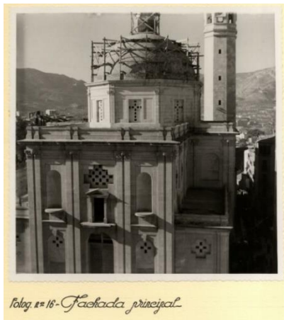
Figura 6: San Mauro y San Francisco de Alcoy [España]