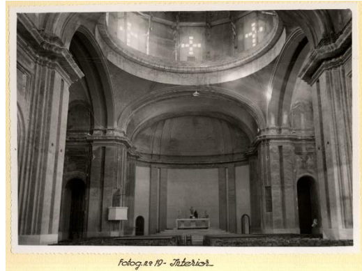
Figura 5: San Mauro y San Francisco de Alcoy