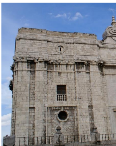
Figura 7: Juan de Herrera. Torre inconclusa de la Catedral de Valladolid