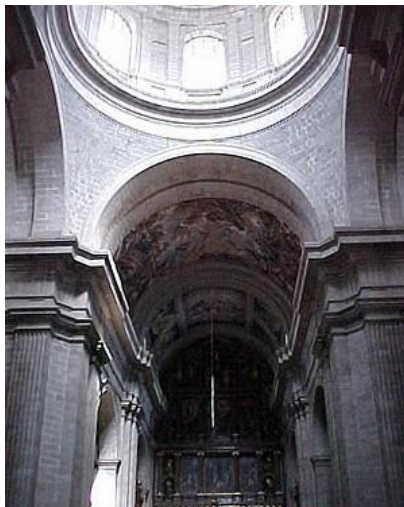
Figura 4: Basílica del Monasterio de El Escorial