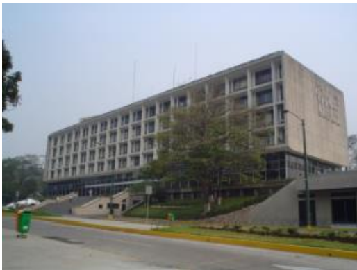
Figura 5: Municipalidad de Guatemala, Guatemala (2005).

Éstos son el Palacio Municipal, el edificio del Instituto Guatemalteco del Seguro Social, el Crédito Hipotecario Nacional, y el Banco de Guatemala siendo éste último, el edificio más alto para la época.