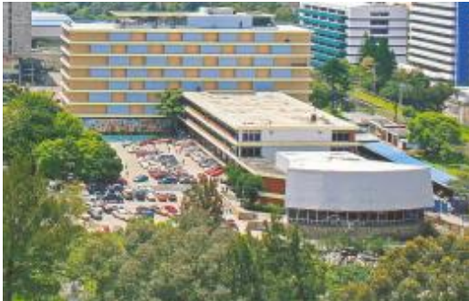
Figura 6: Instituto Guatemalteco del Seguro Social, Guatemala (2005).