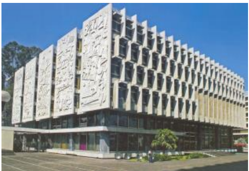
Figura 7: Crédito Hipotecario Nacional, Guatemala (2005).