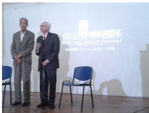
Figura 9: Los creadores del Centro Cívico, arquitectos Carlos Haeussler y Jorge Montes, Guatemala (2014).

Se hizo una presentación de lo avanzado por la mesa técnica a los invitados, para ponerlos en contexto. Luego se les presentó la metodología de trabajo para la conformación de mesas y por último se expusieron las conclusiones de cada mesa para poder enriquecer y validar la Declaratoria de Importancia Patrimonial del Centro Cívico.