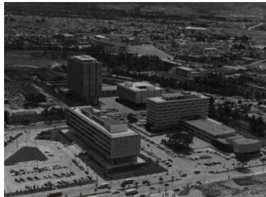
Figura 1: Edificios Centro Cívico primera Fase, Guatemala (1967).

El Centro Cívico de Guatemala, en su primera fase, es un conjunto urbano que está ubicado en el flanco sur de la ciudad el cual albergaría las oficinas de importantes entidades gubernamentales así como la propuesta del “nuevo corazón de ciudad”; asentado en un terreno sin mayores accidentes topográficos ya que esta área se extiende sobre la planicie del “Valle de la Ermita” en donde se asienta actualmente la ciudad capital. A nivel urbano impone otro tipo de traza introduciendo a la ciudad los ejes principales tipo boulevard, los cuales son evidentes en la 6ª avenida la cual sufrió una transformación radical con la demolición de la antigua iglesia del Calvario para poder ser prolongada y la 7ª avenida. Ambas avenidas atraviesan la ciudad de norte a sur. (Fuentes, 2011, 14)