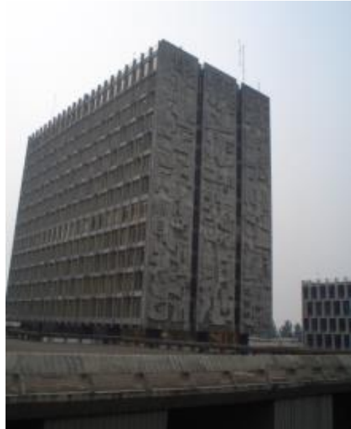
Figura 8: Banco de Guatemala, Guatemala (2005).

Cuando se logra finalizar la primera fase de este conjunto en 1964, se da una dinámica económica que estaba condicionada por factores políticos (cambio de gobierno) y físicos (terremoto de 1976), situaciones que llevaron a que este conjunto urbano, su continuidad en la traza y la aplicación de la plástica, no fueran prioridades en ese momento para el gobierno y llevaron a dejar inconcluso el proyecto. De allí que el resto de los edificios planteados en el centro cívico, la Torre de Tribunales, el Edificio de Finanzas y el edificio del INGUAT, toman otros acentos, más internacionales y carecen de aplicaciones de la plástica, que, si se habían contemplado por lo menos para la torre de tribunales, pero lamentablemente nunca fueron terminadas y el resto del proyecto de corazón de ciudad, tampoco.