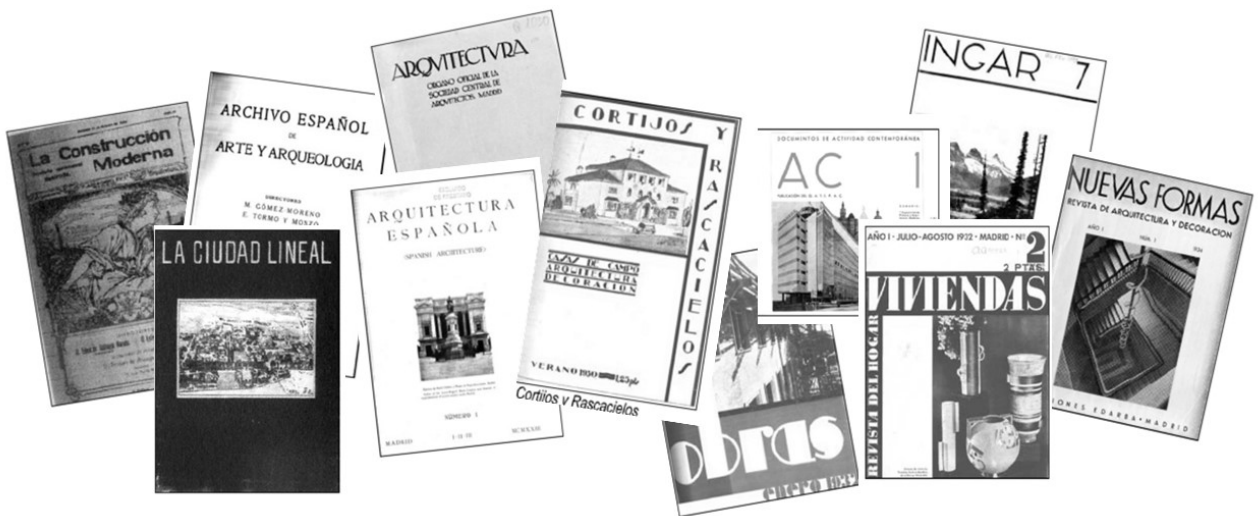
Figura 1: Revistas de arquitectura españolas analizadas en esta investigación

Entre las once revistas seleccionadas, algunas como Ingar , La Ciudad Lineal , Arquitectura Española y Archivo Español de Arte y Arquitectura se centraron en aspectos técnicos o del ámbito del patrimonio. Los escasos artículos que publicaron sobre cuestiones del interior y del mobiliario no reflejaban la introducción de las nuevas formas en España, sino una perspectiva conservadora del campo. Por otro lado, La Construcción Moderna ofreció una visión alejada de las tendencias internacionales y a través de las instalaciones expositivas de la época. El resto de las revistas analizadas, en cambio, acercaron al público un nuevo modo de mirar y percibir el espacio interior, posicionándose frente a este campo de diversas maneras. Cada una de ellas ofrecía una realidad del panorama imperante, situación que propiciaba en algunos momentos miradas cruzadas sin encuentro o, en otros, visiones convergentes en puntos concretos.