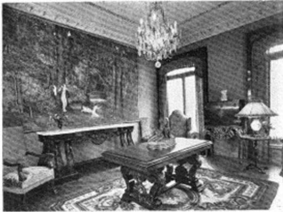
En este comedor de la casa de los señores de Manresa, los muebles y la decoración sirven de modelo a una obra de arte. El último cuadro de Plova Kubis, pintado después de conseguir la Segunda medalla en la Exposición Nacional de Bellas Artes de 1930.

Industria debido al pintor de Tinsmo Plova Kubis. Este país, es poseedor de España en Roma, representa uno de los estilos más bellos del arte moderno español. Persona de gran temperamento, sabe hacer compatible el arte moderno moderno con el gusto más decorado.