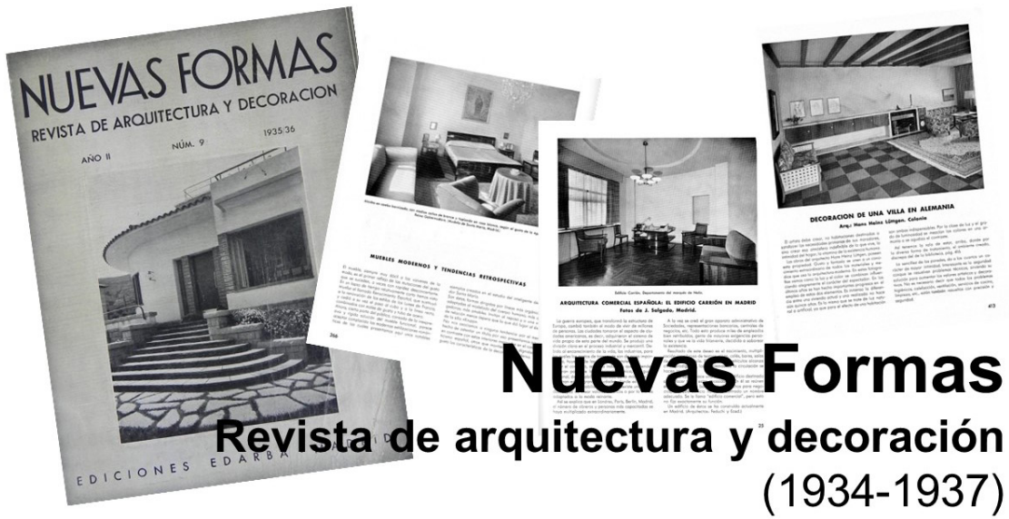
Figura 3: Collage de portada y primeras páginas de artículos de la revista Nuevas Formas

sobre la situación en la que se encontraba el mueble y el interior, es decir, ya afloraba la preocupación sobre el diseño del espacio. A partir de 1925, la revista abordó las obras de mobiliario desde los proyectos de arquitectura, presentando trabajos integrales de arquitectos que diseñaban también el equipamiento. Las obras extranjeras procedían de países europeos, en especial, Alemania y Francia. La revista se hizo eco del trabajo de arquitectos internacionales como Paul Linder (Lacasa, 1924), Marcel Breuer (1933) o André Lurçat (García Mercadal, 1927) y nacionales como José Manuel Aizpurua y Joaquín Labayen (1928, 1929 y 1930), Carlos Arniches y Martín Domínguez (1927 y 1933) o Luis Feduchi (1935), entre otros.