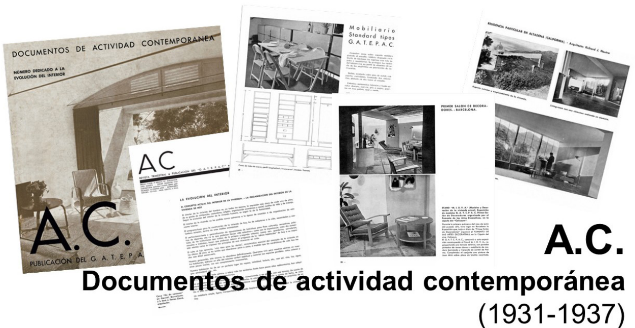
Figura 4: Collage de portada y primeras páginas de artículos de la revista A.C.