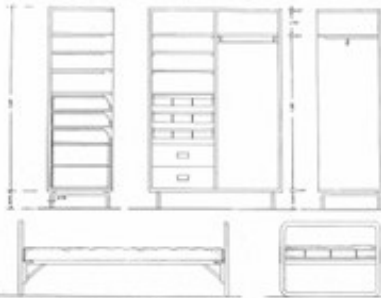
Cama de tubo de acero, perfil longitudinal y transversal (modelo: Thonet).

Sillas de serie: el modelo plegable, en acero inoxidable o pintado al esmalte.