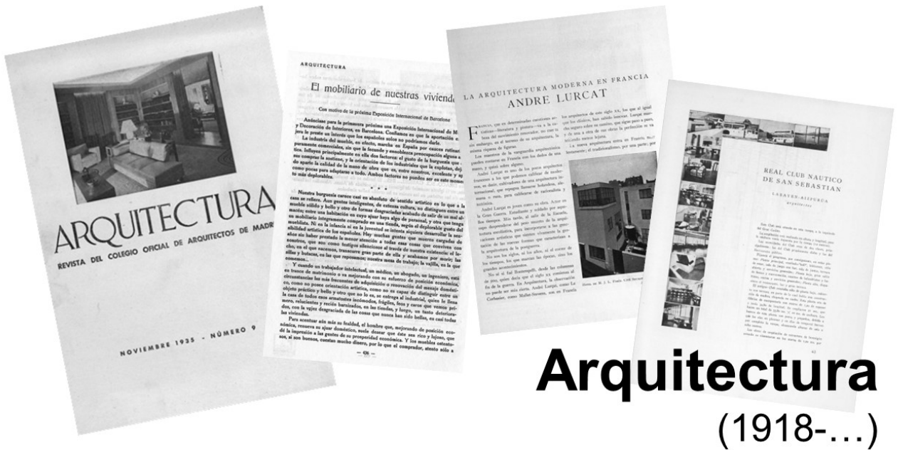
Figura 2. Collage de portada y primeras páginas de artículos de la revista Arquitectura

La revista Arquitectura surgió en mayo de 1918 a través de la Sociedad Central de Arquitectos, una entidad que representaba a profesionales interesados en la formación de Colegios de Arquitectos en España, los cuales se establecieron casi quince años después. Cuando el COAM comenzó sus operaciones en junio de 1931, la Sociedad Central de Arquitectos, responsable de la creación de la revista, propuso al nuevo colegio encargarse de su edición. La propuesta fue aceptada en enero de 1932. Esta colaboración continuó hasta mayo de 1936, momento en el cual la publicación cesó de manera abrupta y sin previo aviso, coincidiendo con el inicio de la guerra civil. https://www.coam.org/es/fundacion/biblioteca/revista-arquitectura-100-anos/arquitectura-etapa-1918-1931 , https://www.coam.org/es/fundacion/biblioteca/revista-arquitectura-100-anos/etapa-1932-1936