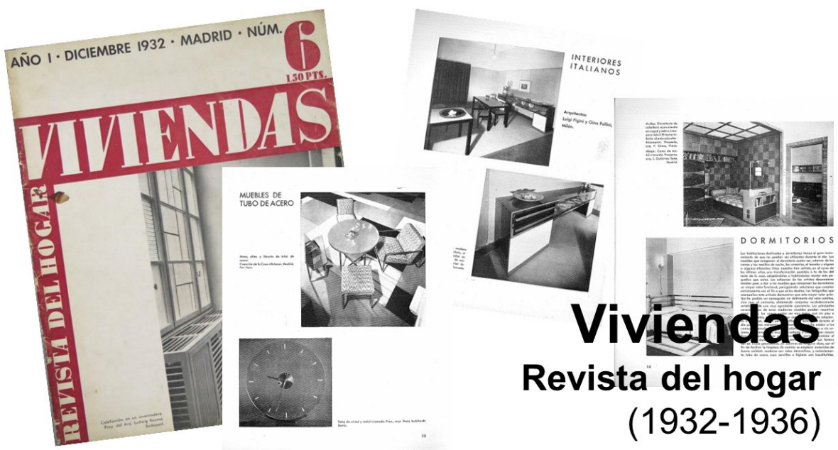
Figura 6: Collage de portada y primeras páginas de artículos de la revista Viviendas