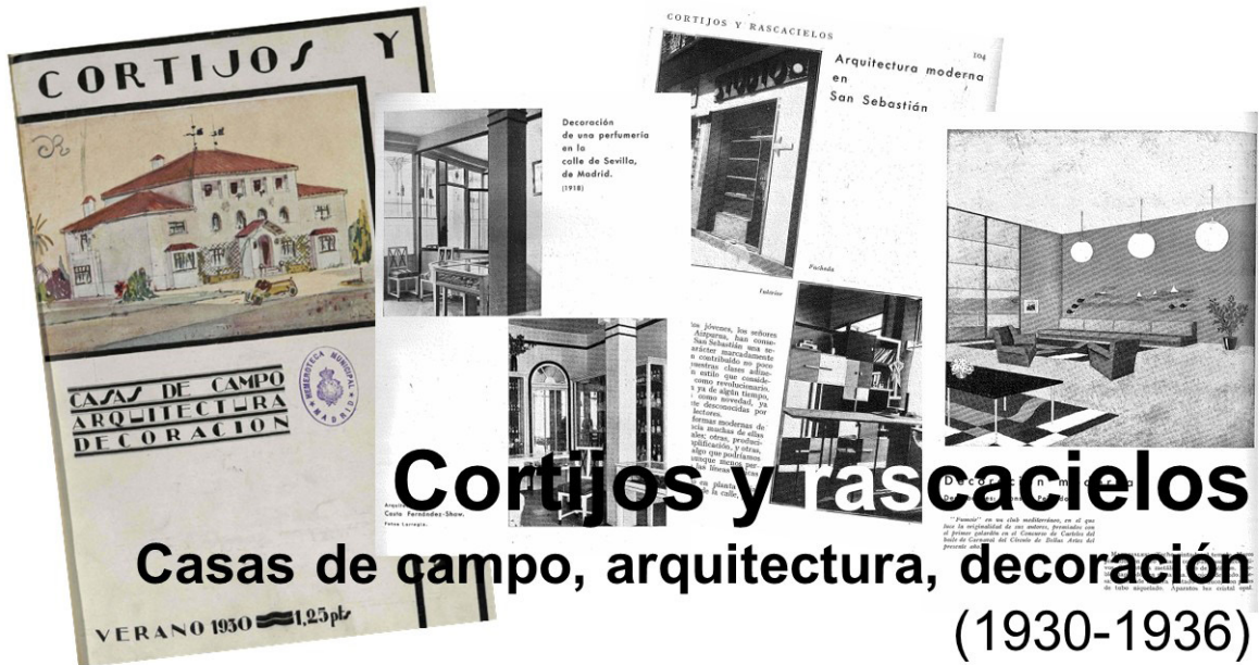
Figura 7: Collage de portada y primeras páginas de artículos de la revista Cortijos y rascacielos