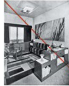
El mobiliario en general cubren. Modelo: Barcelona 1930.

En la industria que cubren los muebles de la Exposición de Bellas Artes de 1930, se ve un ejemplo de la decoración moderna. En el fondo se ve un cuadro de Plova Kubis, pintado en 1930, que representa un ejemplo de la decoración moderna.