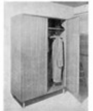
Anterior, fondo, secciones y fotografía.