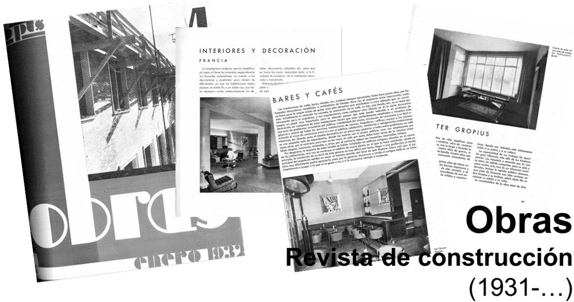
Figura 5: Collage de portada y primeras páginas de artículos de la revista Obras

en obra extranjera, a la cabeza la francesa (en algunos casos, bajo el título de Arquitecturas de hoy) o en los protagonistas del panorama internacional (como Adolf Loos o Walter Gropius), y 7 sobre exposiciones celebradas en el periodo. Resulta interesante cómo del total de artículos, 14 fueron publicados dentro de un espacio, que tuvo ciertas variaciones a lo largo del tiempo. Bajo el título “Interiores y Decoración” o “Interiores”, esta publicación mostró a sus lectores distintas propuestas vinculadas a la adecuación espacial. Esta sección, agrupó tres artículos de carácter genérico con otros temáticos como “Dormitorios”, “Halls”, “Salones”, “Comedores”, “Despachos”, “Cuartos de Niños”, “Boudoirs” y “Cocinas”. Casi la totalidad de los artículos publicados por esta revista sobre interiores, salvo tres nacionales —“Bares y cafés” y “Casablanca”, ambos de Luis Gutiérrez Soto (1933, 1933b), y “Una tienda moderna en la avenida del Conde de Peñalver” de Francisco Ferrer (1935)—, mostraban espacios realizados en otros países europeos.