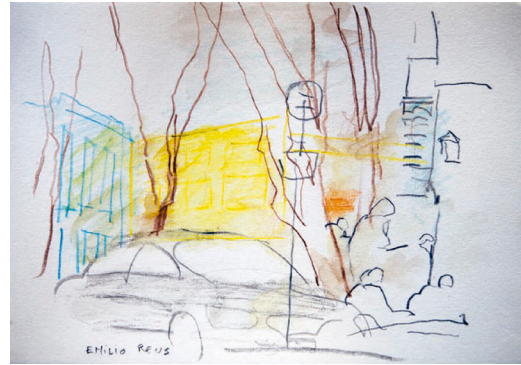
Figura 2: Dibujo de Hugo Gilmet. Calle Emilio Reus, 2016

cuerpo y cuando ese eco de la luz, el color, la profundidad espacial, las texturas, las materialidades, origina un trazado visible para otras personas, como lo hace un dibujo, “aparece un visible a la segunda potencia, esencia carnal o ícono del primero” (p. 19). Entonces, más allá del carácter mimético o de evocación del tema representado, si se observa la Figura 2 ¿será que parte de la experiencia corporal del dibujante queda expresada en esas líneas y zonas sombreadas?