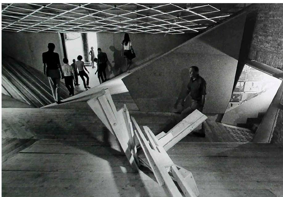
Figura 1: Fotografía de Gilles Ehrmann. Pabellón de Francia, Bienal de Arquitectura de Venecia de 1970

Como se ha expresado, las tecnologías son las mediadoras entre el sujeto y el mundo; ahora bien, coincidiendo con Calvino (1996), “los media más potentes no hacen sino transformar el mundo en imágenes y multiplicarlas a través de fantasmagoría de juego de espejos: imágenes que en gran parte carecen de la necesidad interna que debería caracterizar a toda imagen” (p. 73). El lenguaje gráfico digital se dispone veloz, aunque, no sin cierta inconsistencia, homogeniza y nivela; en su inmediatez se pierde riqueza cognoscitiva y potencia significativa. Para Serres (2019), entre las antiguas técnicas y las nuevas tecnologías de la información existe una diferenciación clave, las últimas no tienen una finalidad directa o intención inicial determinada; en consecuencia pueden ser utilizadas para cualquier fin, transfieren el proyecto de utilidad del constructor al usuario, que los emplea a su gusto y como mejor le parezca. Aun así, es a partir de comprender aquello que se representa que se comienza a participar ( ser parte ). “Es necesario que el pensamiento