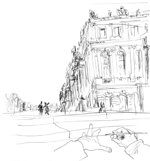
Figura 3: Dibujo de Álvaro Siza, Versalhes Fuente: Siza y Chiaramonte, 2015, p. 61

muchas veces con el agregado de textos explicativos y comentarios que indican relaciones, hallazgos, o bien indagan en el espacio circundante.