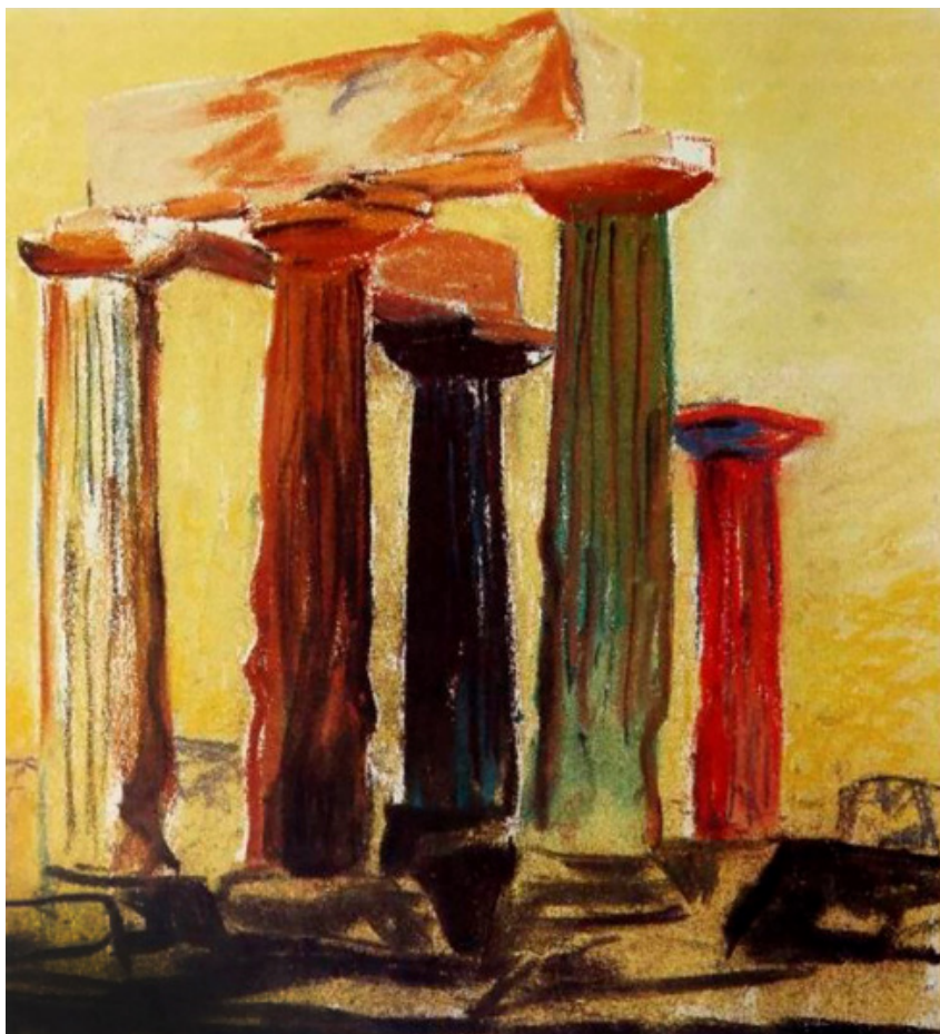
Figura 6: Dibujo de Louis Kahn, Columns Temple of Apollo, Corinth, 1951