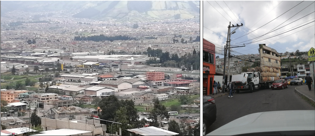
Figura 3: Zonas urbano-industriales al sur de Quito y utilización de la vía pública para el transporte industrial

Los intereses y las concepciones diferentes que subyacen a la convivencia de lo industrial y lo urbano son los ejes fundamentales en los que existen y se manifiestan las incompatibilidades relacionadas con el uso del suelo, el espacio público y el derecho a la ciudad; mientras que, para la lógica de los pobladores, lo urbano es el territorio en el que ocurre y se desenvuelve la vida y lo cotidiano, lo social y lo cultural (Figura 3); para lo industrial, el territorio es el espacio en el ocurren y deben seguir ocurriendo procesos, a gran escala, de transformación de materia y energía para la generación de bienes y ganancias.