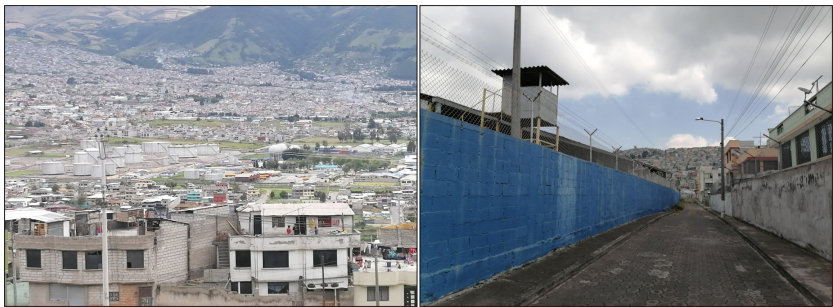
Figura 2: Zonas urbano-industrial Beaterio, muro de una fábrica que rompe con lo urbano

Lo que es evidente en la política pública relacionada con lo industrial, incluso en la lógica de lo industrial dentro de lo urbano, es que se han diseñado medidas de protección y reducción de impactos, en especial relacionados con el medio ambiente y con la prevención de daños o efectos en la población de las zonas urbanas inmediatamente aledañas a las fábricas. Sin embargo, las lógicas y dinámicas urbanas siguen y seguirán supeditadas a las necesidades y comodidades de lo industrial.