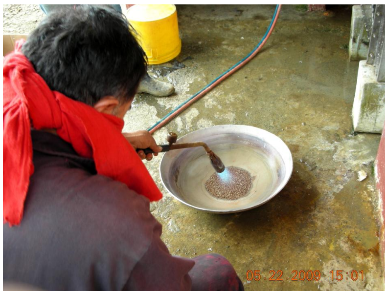
Figura 1. Fotografía del proceso de quema de amalgama en uno de los campamentos.

Se empleó un diseño experimental aleatorio, descriptivo y analítico (Hernández y col., 2007). Para la recolección de datos experimentales se seleccionaron 4 campamentos mineros (por muestreo sesgado) localizados en la comunidad de Bella Rica de Ponce Enríquez, en la Provincia del Azuay, que se sitúan entre los 835 y 1057 msnm a una distancia de 17,5 km desde Ponce Enríquez (Latitud 3°04'12"S - Longitud: 79°41'56"O). El muestreo durante los procesos de quema de amalgama se realizó bajo las dos condiciones de trabajo observadas: quema directa de la amalgama y ataque previo con ácido nítrico ( \text{HNO}_3 ) concentrado + quema directa, estos métodos se describen a continuación: