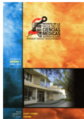
Revista No. 1, Vol. 31, 2013