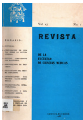
Revista No. 1, Vol. 17, 1988