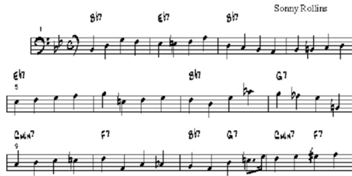
Figura 4. Walking bass

Copyright 2013 Blues Studies Greg Fishman