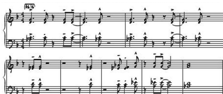
Figura 6. Comping piano

Estas son otras rítmicas que se suelen utilizar: