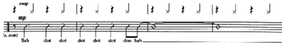
Figura 3. Tiempos fuertes en el jazz