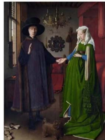
Imagen 2. Para amantes de la pintura

Si todo el mundo, incluidas las mujeres, se parecen a Putin, es Van Eyck