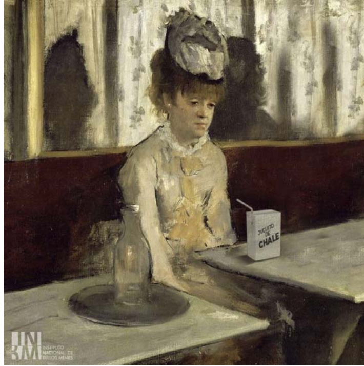
Imagen 3. Embriagarse hasta perder la autocompasión