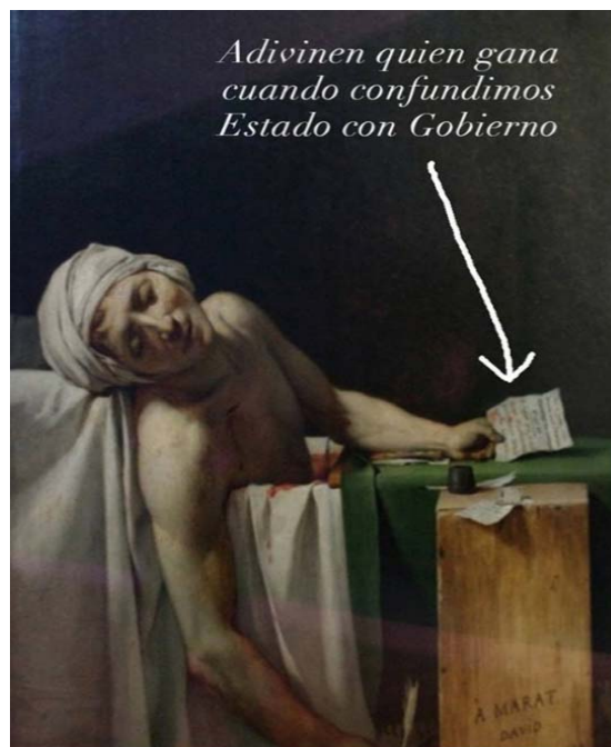
Imagen 7. Obra de la exposición virtual "Start-Up", Arturo Cariceo.