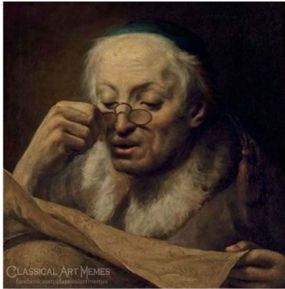
Imagen 4. Classical Art Memes

When you see a meme that you haven't seen before