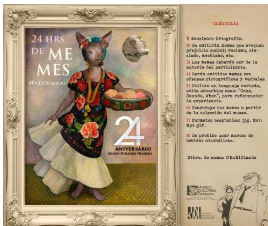
Imagen 8. Bases del concurso “24 horas de Memes en el Dolores Olmedo”

Las bases del concurso se dieron a conocer como se muestra en la imagen 8