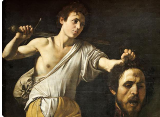
Imagen 1. #RebautizaTuObraDeArte