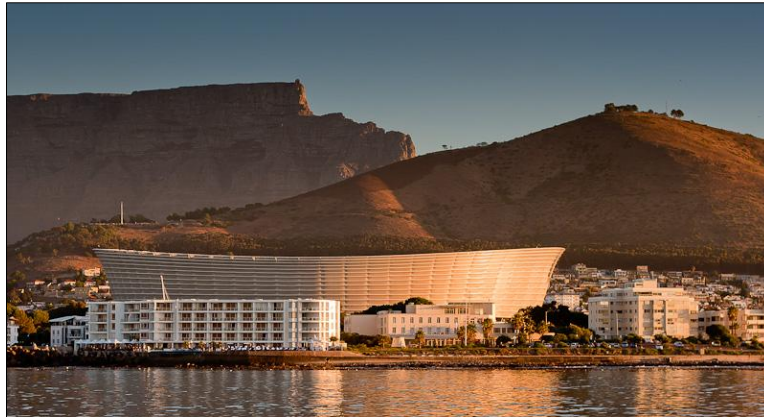
FIGURA 6. Point Architects & Urban Designers, Louis Karol Architects y GMP. Estadio Green Point. 2006-2009. Ciudad del Cabo (Sudáfrica).

predefinido, un enorme parque en cuyo extremo se erige. Se ha concebido como un objeto mudo y discreto , ligero y suave aunque con personalidad propia, pues frente a la horizontalidad determinada por el cercano océano Atlántico y por el monte Mesa (cuyo nombre hace honor a su aspecto), el estadio dibuja un perfil suavemente ondulado en forma de silla de montar 53 que, entre tanto desapercibimiento, consigue imprimir carácter al resultado final (figura 6). En realidad se trata de una curvatura determinada por la fuerza del viento que sopla en la ciudad y que impedía otro tipo de solución más plana. Sin embargo, lo que era un apriorismo y, en consecuencia, una limitación, se convierte en la seña de identidad del lugar.