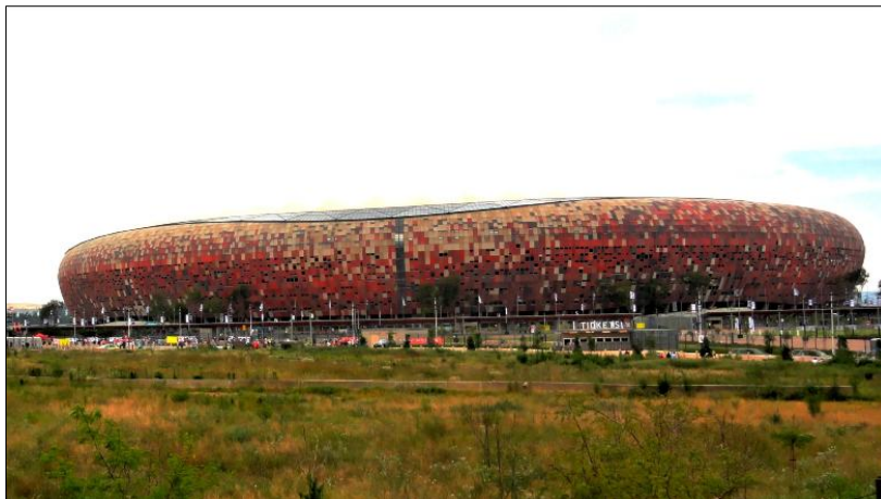
FIGURA 4. Boogertman Urban Edge & Partners y Populous. Estadio Nacional . 2009. Johannesburgo (Sudáfrica).

Idéntica presunción motiva la construcción del estadio Moses Mabhida 45 de Durban (2006-2009) en un enclave alejado del centro de la ciudad, de pasado ferroviario aunque a orillas del océano Índico 46 . En este caso, además de por la capacidad de atracción e impulso económico y urbanístico que el lugar puede proporcionar, su aislada posición asiste a los que resultan ser los principales atractivos de la estructura: un