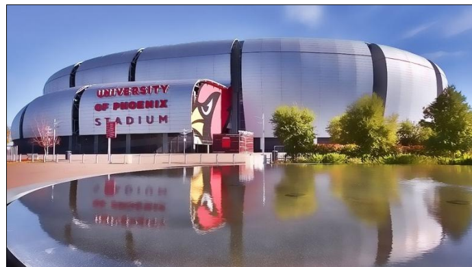
FIGURA 1. Peter Eisenman y HOK. Estadio de los Arizona Cardinals de la Universidad de Phoenix . 2006. Glendale, Arizona (EEUU).

Pese a la selección realizada en este artículo, no nos gustaría dejar de citar aquí, por su espectacularidad, algunas de las últimas incorporaciones a la nómina de foros del fútbol americano. Hablamos, por ejemplo, del estadio Soldier Field, sede de los Chicago Bears (Wood + Zapata, 2003) o del de los Arizona Cardinals de la Universidad de Phoenix, erigido en Glendale, Estados Unidos, a partir de un diseño de Peter Eisenman en colaboración con los ingenieros y consultores de HOK (2006) (figura 1).