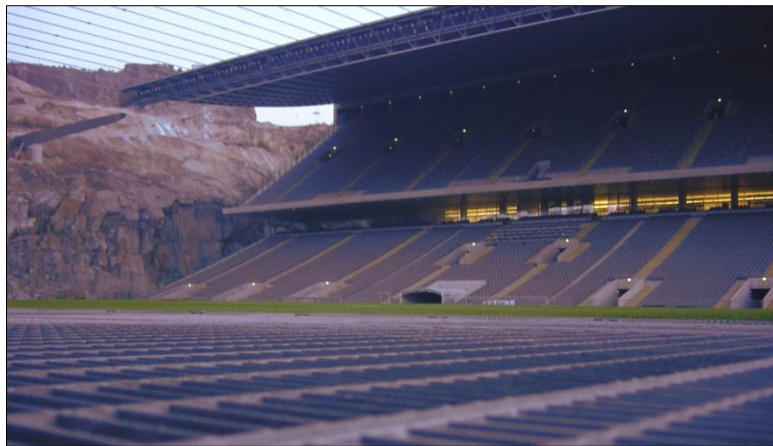
FIGURA 3. Eduardo Souto de Moura. Estadio municipal de Braga (vista del interior). 2000-2003. Braga (Portugal).