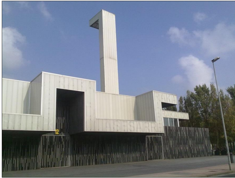
FIGURA 2. Eduardo Arroyo. Estadio de Lasarre (detalle del exterior). 1999-2003. Baracaldo, Vizcaya (España).

sobrio en su estructura aunque atractivo en su resultado, multifacético en su destino y simbólico en su definición 19 .