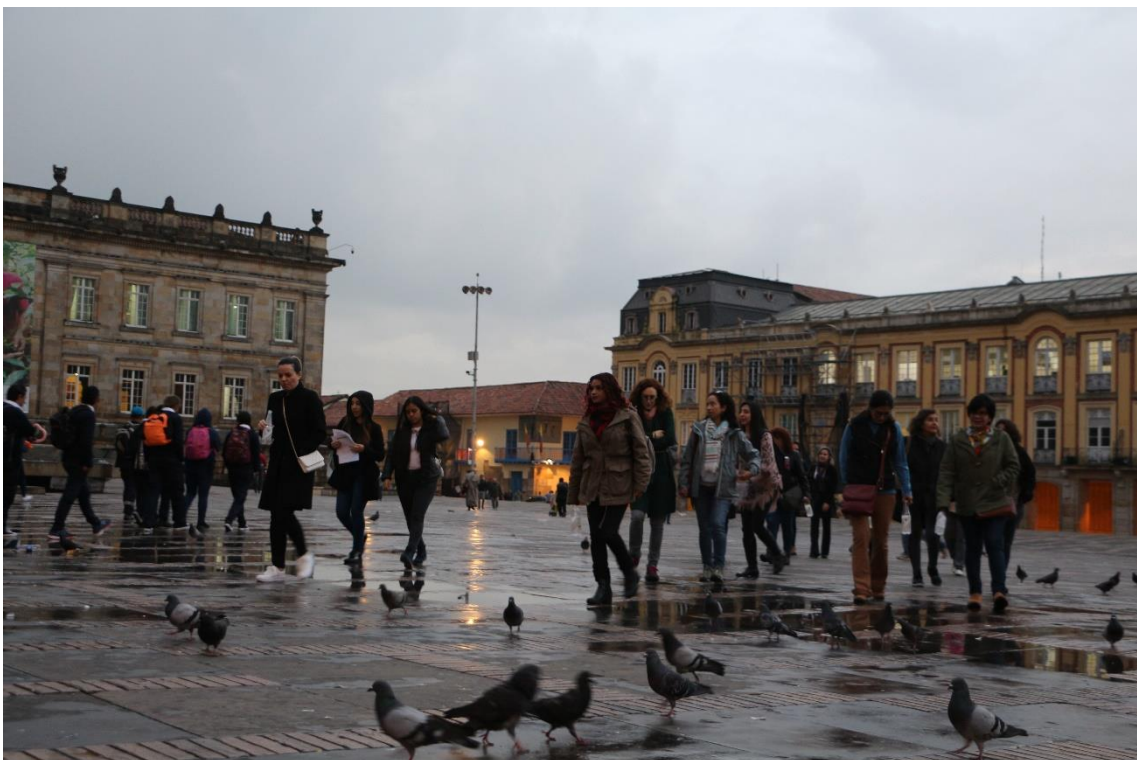
Figura 6. Recorrido en X Comité de Igualdad UCCI.