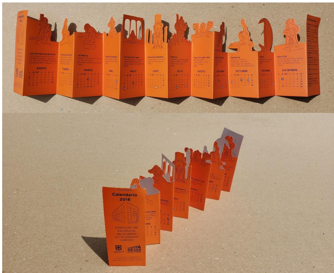
Figura 19 y 20. Calendario 2018, plegable con selección de doce esculturas femeninas de Bogotá.

La información contenida en la pieza gráfica, a modo de ficha técnica, especifica: el título de la obra, su ubicación geográfica, la autoría (solo en uno de estos casos se trata de una escultora) y la fecha de elaboración. Tiene una dimensión de 11,4 x 68 cm. extendida que se convierten en 11,4 x 4,8 cm. plegada en 14 cuerpos. Para el año 2018, el plegable fue entregado durante las visitas a las esculturas, así como en otras ocasiones, e invita a quienes participan en los recorridos a conocer las obras que están dentro y fuera del circuito del centro histórico bogotano.