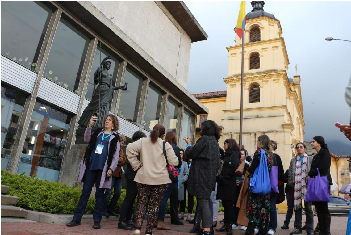
Figura 5. Visita a la escultura de la Minerva, X Comité de Igualdad UCCI.