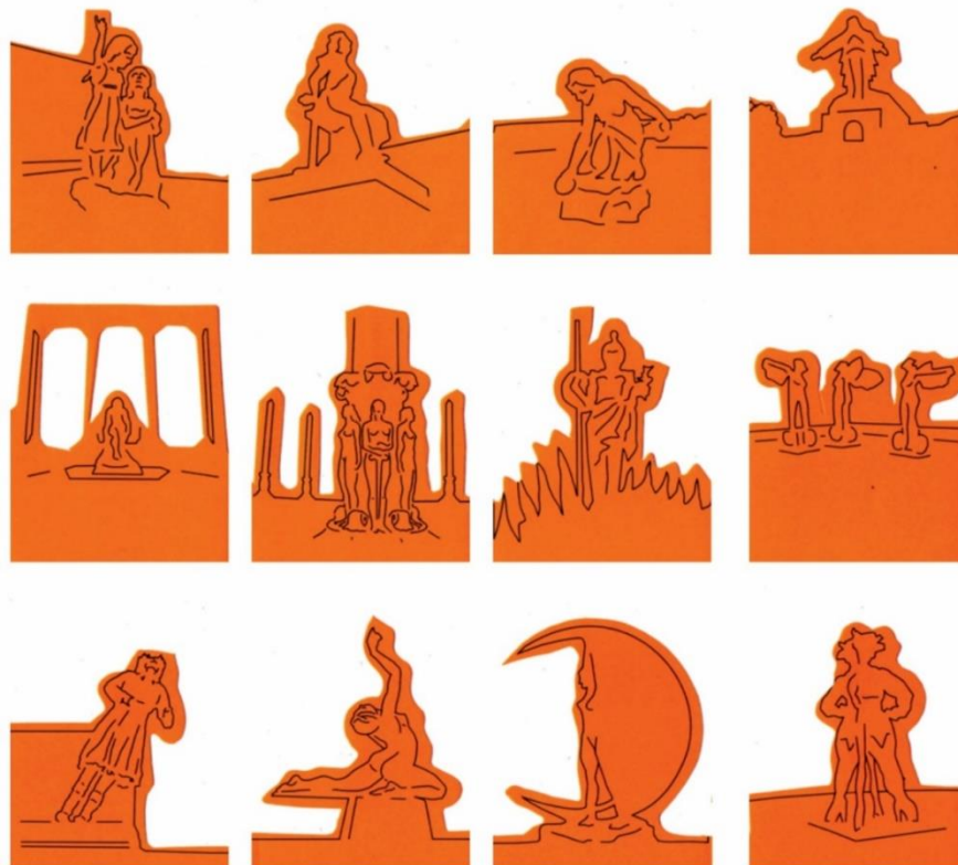
Figuras 7 a 18. Selección de doce esculturas del Calendario 2018, Bogotá.