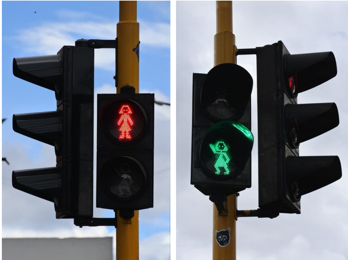
Figuras 2 y 3. “La Peatona” señalización semafórica incluyente, Bogotá.

En el marco de la transversalización de género, la Secretaría Distrital de la Mujer de Bogotá realiza recorridos patrimoniales con perspectiva de género para fortalecer la cercanía de las mujeres con la ciudad. El artículo “Mujeres, patrimonio y ciudad: En bici por monumentos y espacios simbólicos de y para ellas en Bogotá” publicado en la Revista Transporte y Territorio (Sánchez y Triana, 2017), amplía los orígenes y proceso de esta acción simbólica.