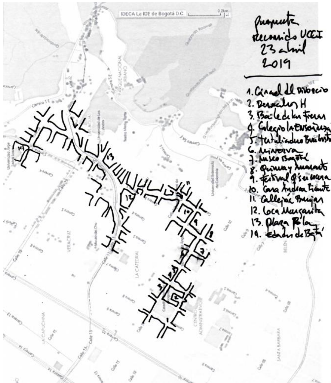
Figura 4. Dibujo recorrido X Reunión del Comité de Igualdad de la Unión de Ciudades Capitales Iberoamericanas - UCCI, abril de 2019.