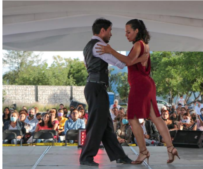
Figura 4. Exhibición Parque Gran Cué, Corregidora.

Lo cultural a partir de integrar en el proyecto la participación de emprendedores gastronómicos de comidas argentinas, fabricantes de calzado así como la formación de público hacia el tango y la apertura a participar de la expresión cultural tanguera por excelencia “La Milonga”.