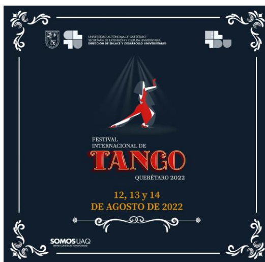
Figura 2. Promocional del 1er. Festival Internacional de Tango

Este caso se presenta como ejemplo de construcción de un proyecto artístico-cultural de extensionismo universitario, donde se describirán algunas características que se integran de los aspectos mencionados en todo este trabajo.