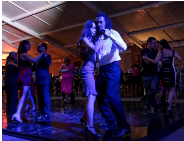
Figura 5. Noche de Gala “La Milonga del Festival” Balvanera Polo & Country Club

Los actores: los principales que fueron declarados los dueños del proyecto que fue la comunidad artística tanguera, a los que les sumó gobiernos municipales de dos distritos, empresarios, emprendedores, y por supuesto la Universidad Autónoma de Querétaro a través de la Dirección de Enlace y Desarrollo Universitario de la Secretaría de Extensión y Cultura.