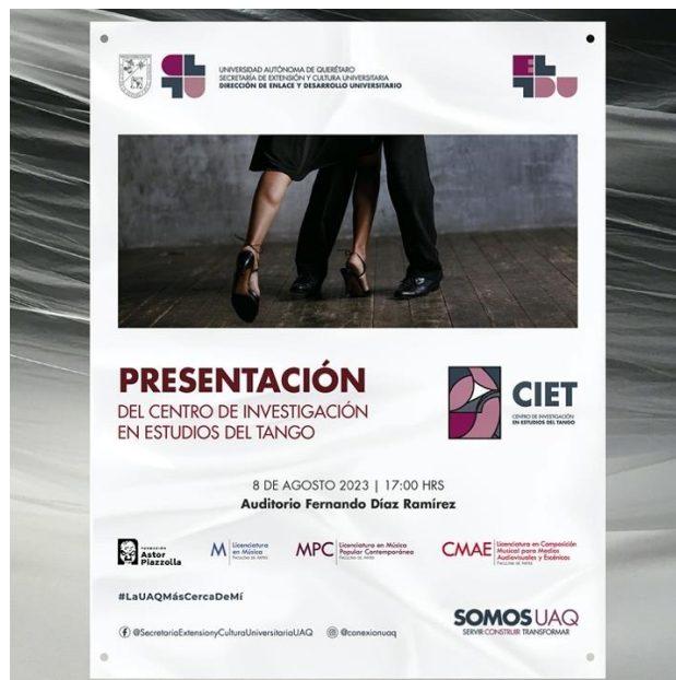
Figura 6. Presentación CIET y Firma de convenio con Fundación Astor Piazzolla

Firma del convenio de colaboración con la Fundación Astor Piazzolla (Argentina).