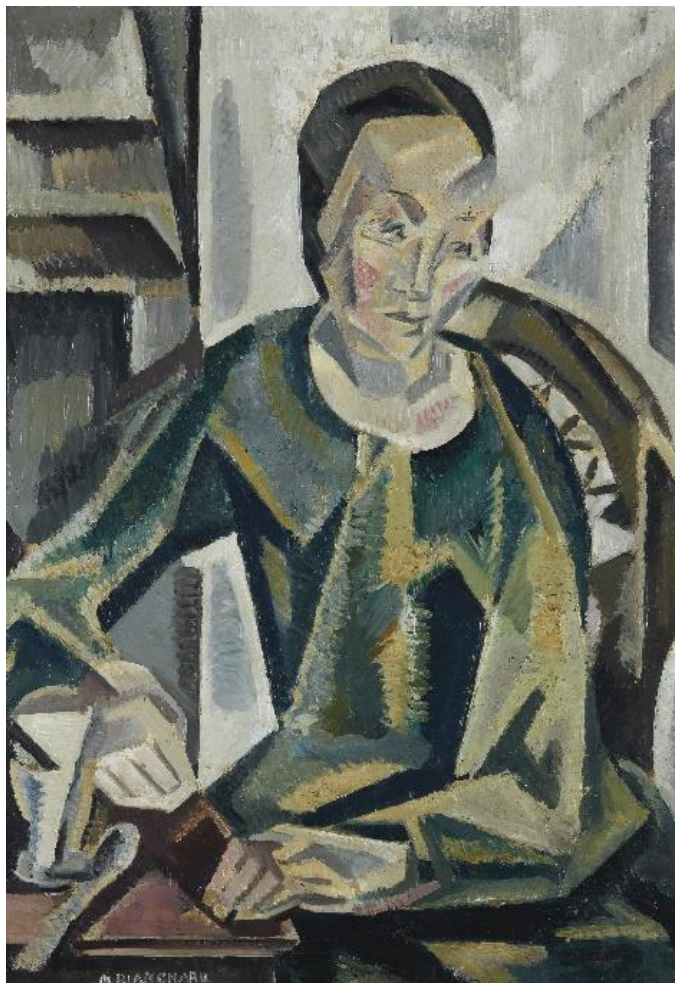
Figura n 3. María Blanchard. El almuerzo , c. 1919-1920; óleo sobre lienzo, 65 x 46 cm. Colección particular. https://www.christies.com/lotfinder/Lot/maria-blanchard-santander-1881-paris-1932-5120849-details.aspx

Tras este ultimátum la artista se encuentra sola y dada su precaria situación económica debe de buscar un nuevo marchante. Paradójicamente, es el hermano de Léonce, Paúl Rosenberg el que se interesa por su producción y compra alguna de sus composiciones, pero sin llegar a un contrato exclusivo.