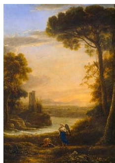
Figura 7. Imagen del cuadro de Claudio de Lorena, Paisaje con Tobías y el Arcángel Rafael , 1640.