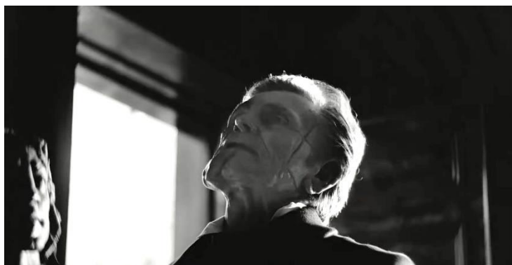
Figura 3. Imagen del retrato del doctor Godwin donde se aprecian las cicatrices en forma de cruz en su rostro.

El doctor Godwin es, dentro de Pobres criaturas , el Jesucristo bíblico, hijo de Dios, un carpintero esta vez hecho doctor, alguien con las cicatrices justas para que descubramos en su rostro la de la propia cruz bíblica (Figura 3) y con el nombre adecuado para que leamos la palabra Dios, Godwin (Dios gana). De todo ello se destila la retórica genial que plantea el director de la película, la contraposición entre la ciencia y la religión, convirtiendo así a su Jesús, hijo de Dios, en un científico que juega con los cuerpos, los transforma, los reinventa.