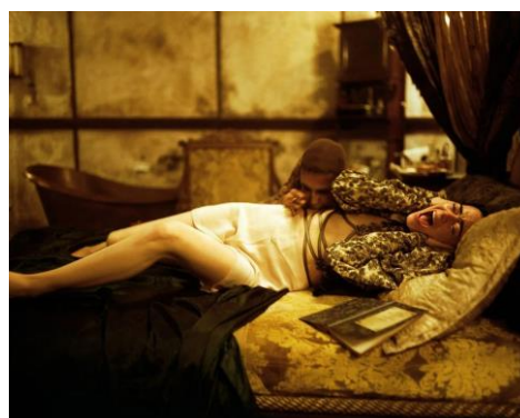
Figura 5. Imagen rescatada de la película Pobres criaturas , en la que la Madame muerde a Bella en el cuello.