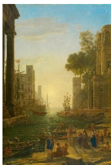
Figura 6. Imagen del cuadro de Claudio de Lorena, Embarco de Santa Paula , 1639.

Mientras Bella Baxter se va apropiando poco a poco de su destino, llegará al conocimiento liberador, aunque desalentador, de la política que rige el mundo. Cuando la protagonista consigue ver lo que la rodea, la pobreza y sus terribles consecuencias le azotarán el espíritu, dejándola afligida ante sus injusticias.