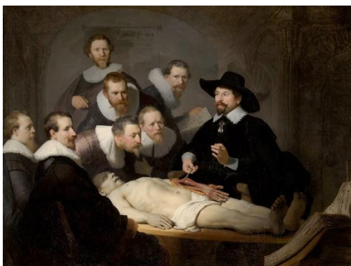
Figura 1. Lección de anatomía del Doctor Nicolaes Tulp , Rembrandt (1632).

Las metáforas visuales que nos acercan al mundo de Bella Baxter son esenciales para comprender el símil con la sociedad en la que vivimos. El padre o creador de Bella es un doctor obsesionado con la ciencia, que hibrida animales para crear otras especies nuevas, que enseña anatomía a un público masculino ávido de enseñanzas, con una poética visual aparentemente inspirada en Rembrandt, con su Lección de anatomía del Doctor Nicolaes Tulp (Figura 1 y Figura 2, comparativa de la imagen fílmica y pictórica).