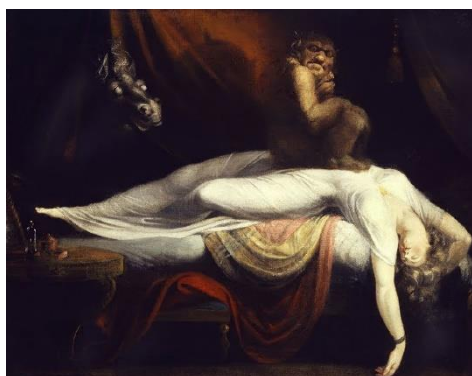
Figura 4. Imagen de la obra pictórica La Pesadilla de Johann Heinrich Füssli (1781).

Como pista para desentrañar las circunstancias de la visión abolicionista, el cineasta ha construido una escena en la que la Madame o matrona muerde a Bella Baxter en el cuello mientras esta está tendida en una cama, referencia estética y visual a la obra La pesadilla de Johann Heinrich Füssli (1781); en la escena pictórica el personaje del íncubo, ese demonio propio de sueños eróticos, está sentado sobre el torso de la joven dudando sobre si poseerla, envueltos en un halo terrorífico y fantasmal. Entonces pareciera claro el posicionamiento sobre la posesión del alma de la joven, sobre lo terrorífico de cuanto le rodea (Figura 4 y Figura 5, comparativa de la obra pictórica con la escena de la película).